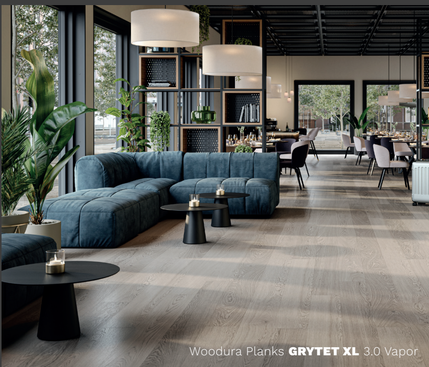
Woodura Planks GRYTET XL 3.0 Vapor

Skandist inspireeritud palett. Kolleksioon täiendab Woodura 3.0 kõvendatud puitpõrandate valikut.